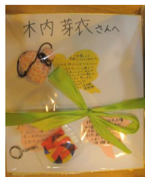
13年生全員に贈られた記念品